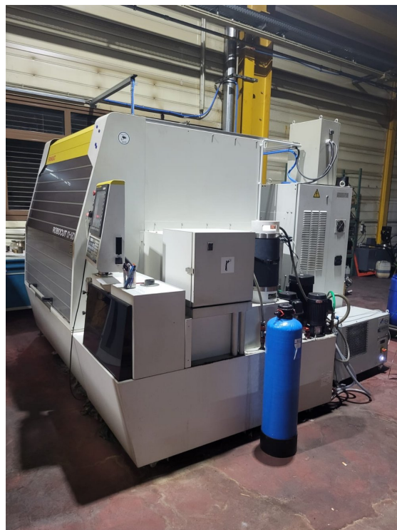
FANUC ROBOCUT ±iD – Bild 2 von 8