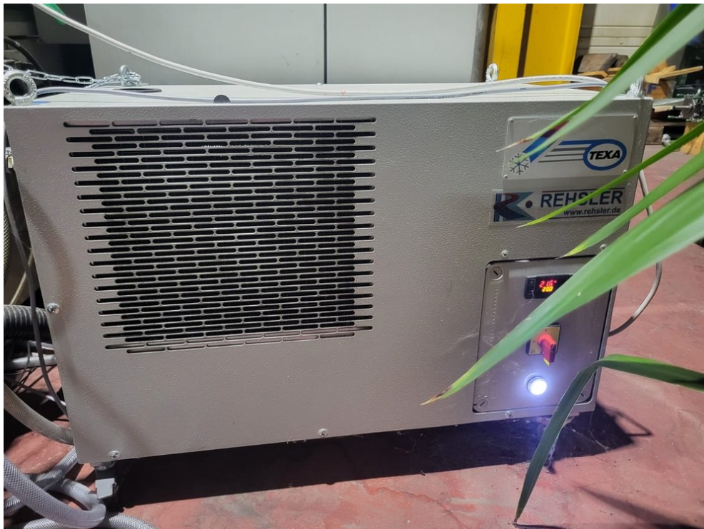
FANUC ROBOCUT ±iD – Bild 3 von 8