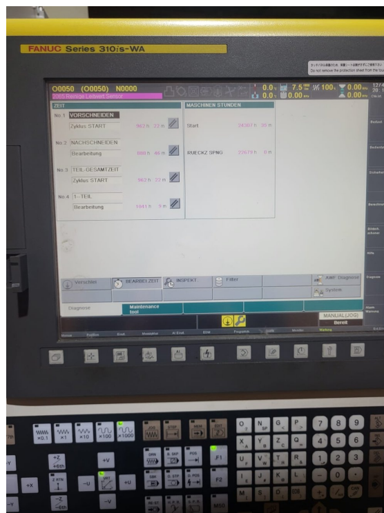
FANUC ROBOCUT ±iD – Bild 7 von 8