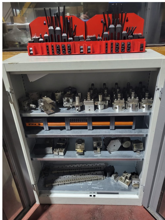
FANUC ROBOCUT ±iD – Bild 4 von 8