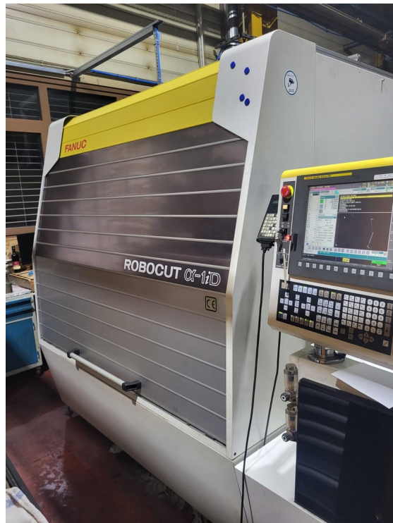
FANUC ROBOCUT ±iD – Bild 1 von 8