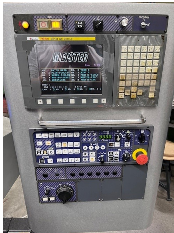
AMADA MEISTER G3 – Bild 4 von 7