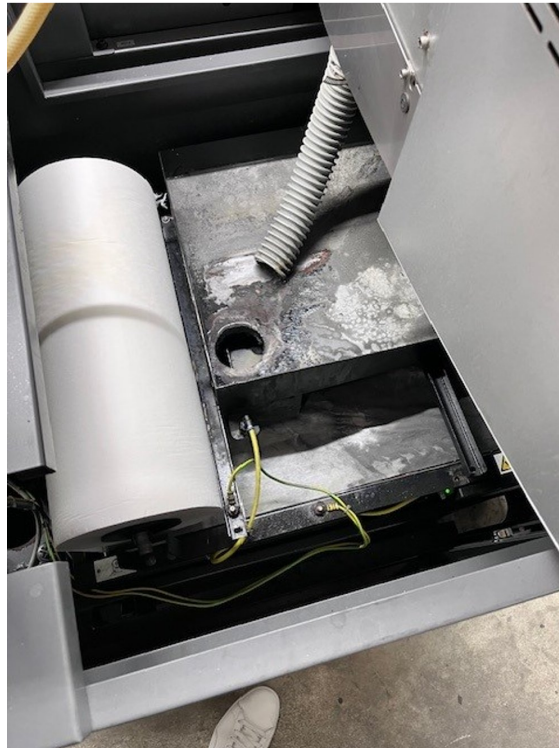
AMADA MEISTER G3 – Bild 7 von 7