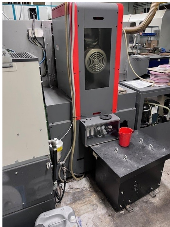
AMADA MEISTER G3 – Bild 6 von 7