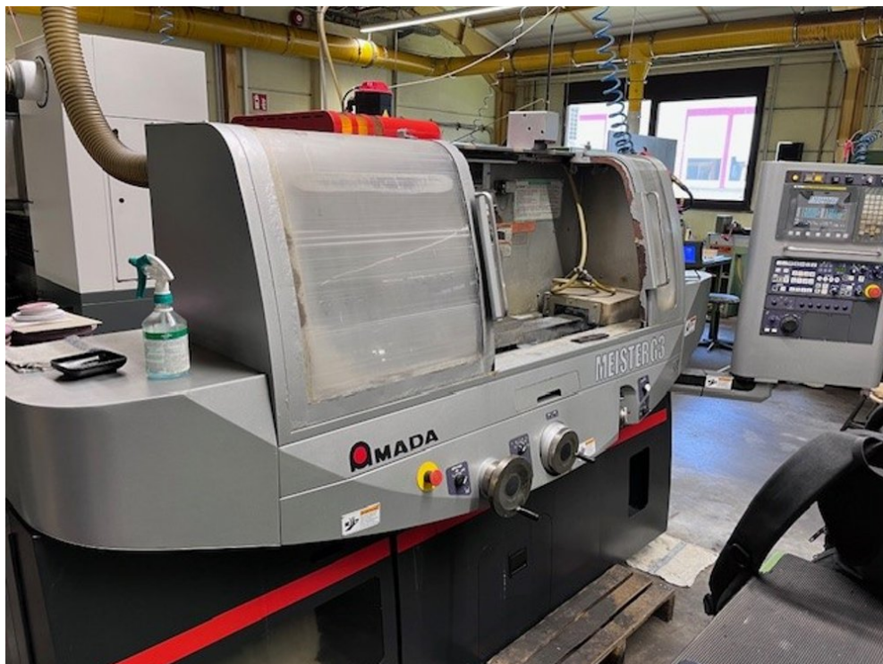
AMADA MEISTER G3 – Bild 2 von 7