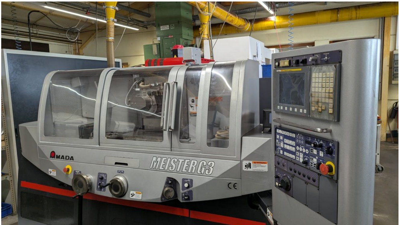
AMADA MEISTER G3 – Bild 1 von 7