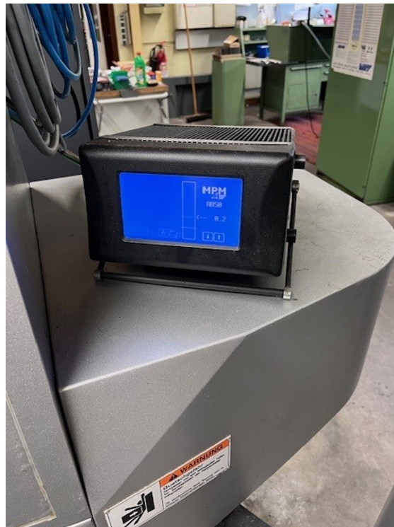
AMADA MEISTER G3 – Bild 5 von 7