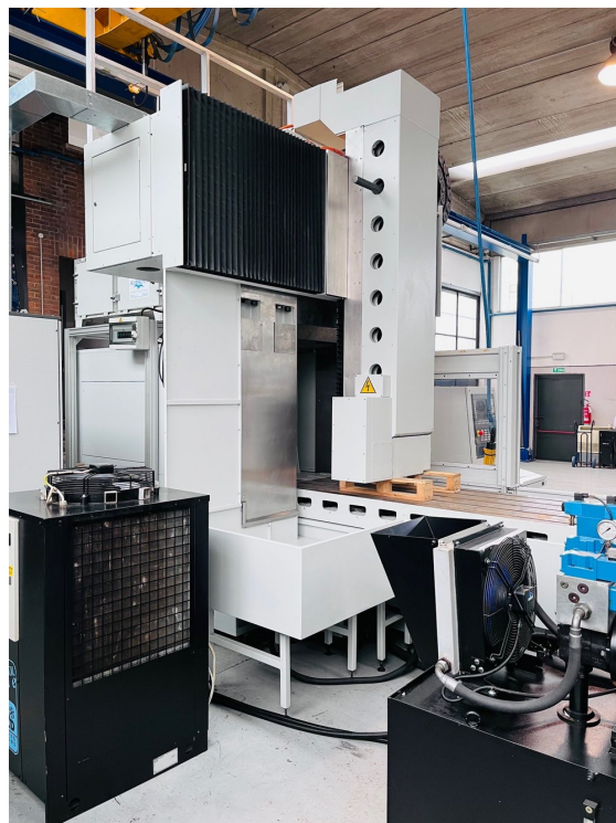
FAVRETTO ME 200 – Bild 2 von 7