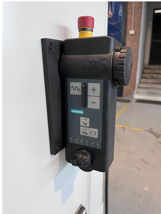
FAVRETTO ME 200 – Bild 5 von 7