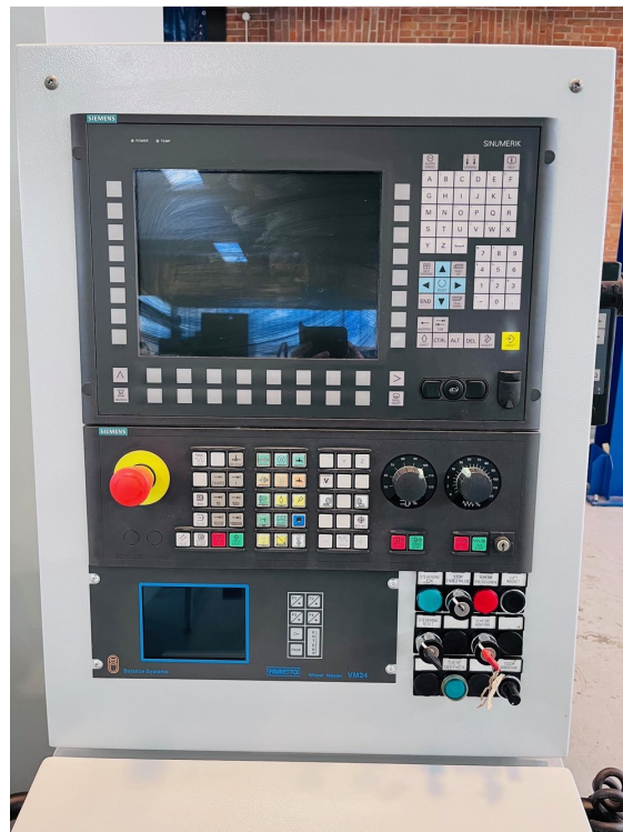
FAVRETTO ME 200 – Bild 7 von 7