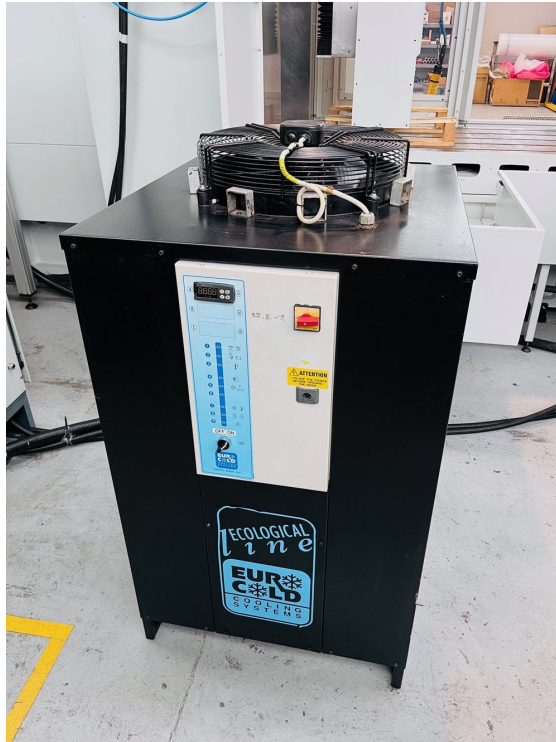
FAVRETTO ME 200 – Bild 3 von 7