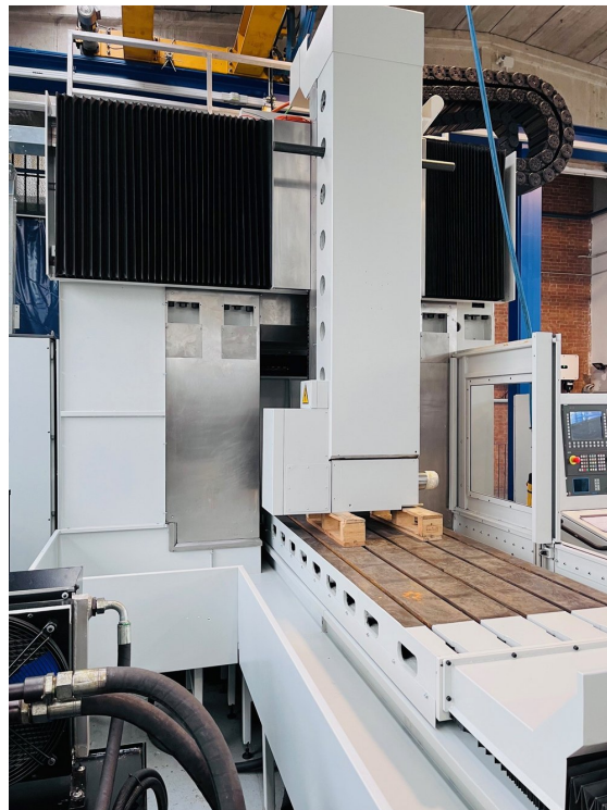
FAVRETTO ME 200 – Bild 1 von 7