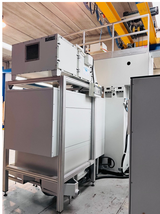
FAVRETTO ME 200 – Bild 6 von 7