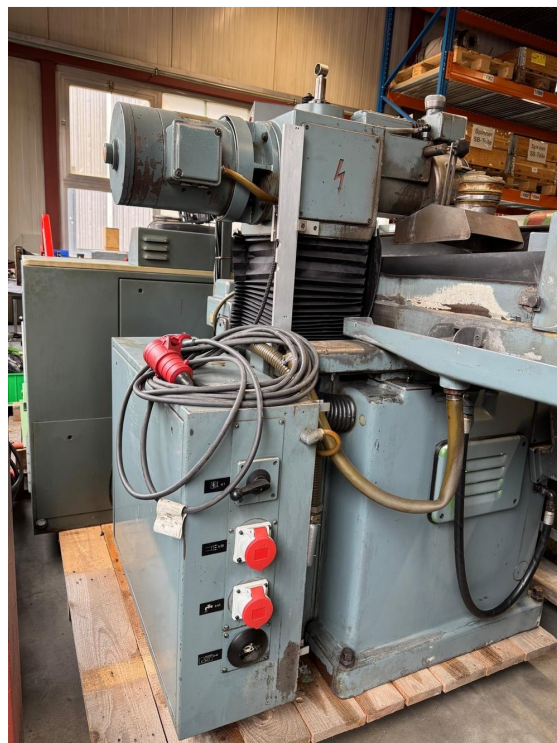
JUNG HF50 – Bild 6 von 6