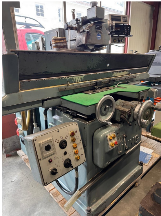
JUNG HF50 – Bild 1 von 6