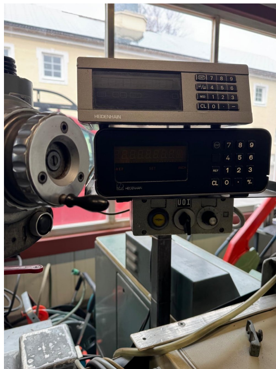
JUNG HF50 – Bild 4 von 6