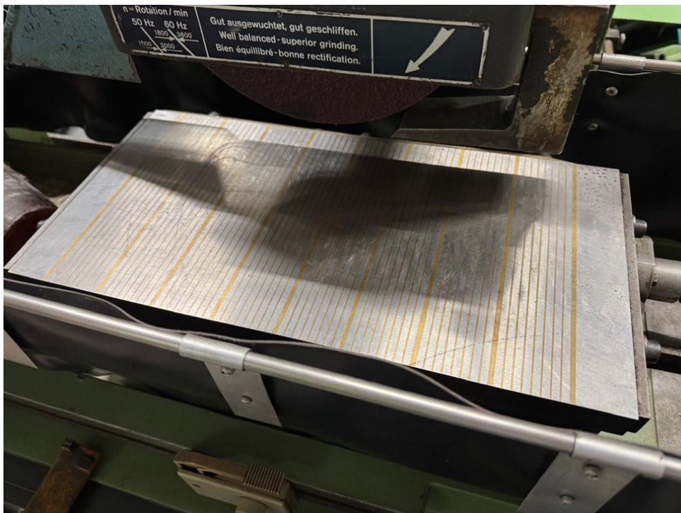
JUNG HF50 – Bild 3 von 6