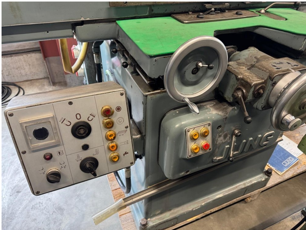
JUNG HF50 – Bild 5 von 6