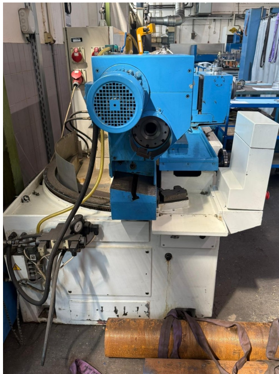
TOS BDU 250A – Bild 1 von 4