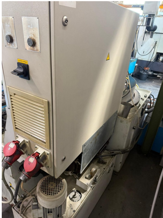
TOS BDU 250A – Bild 2 von 4