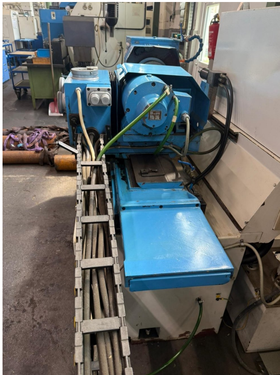
TOS BDU 250A – Bild 4 von 4